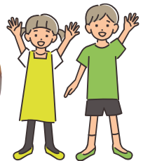
もり どうぶつ 森の動物たち

こころ よご じしよう 心の汚れた自称、 スペイン・サラゴサ万博 マスコットの おせん せい 汚染の精